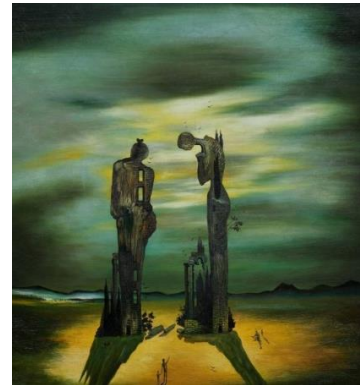
Réminiscence archéologique de l'angélus de Millet –Salvador Dali (1935)

En comparant ces deux tableaux, on constate que le sujet est le même : l'homme et la femme en train de prier avec à l'arrière-plan le clocher d'une Eglise. Par contre le « décor » change :