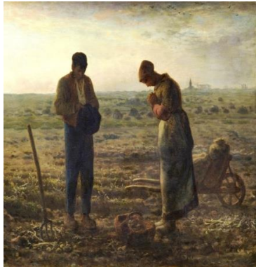
L'angélus de Jean François Millet (1858)