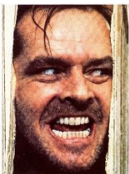
STANLEY KUBRICK SHINING